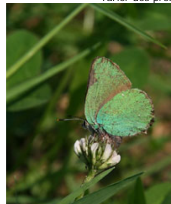
Thécla de la ronce