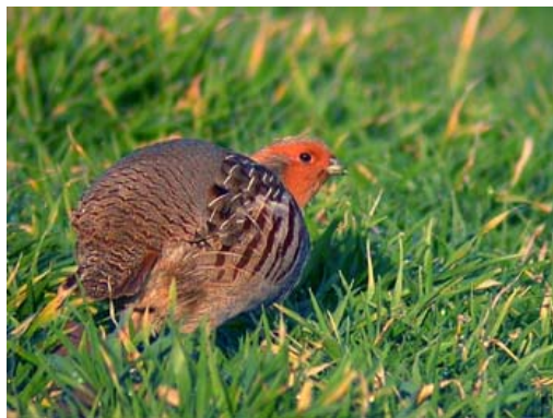
Perdrix grise