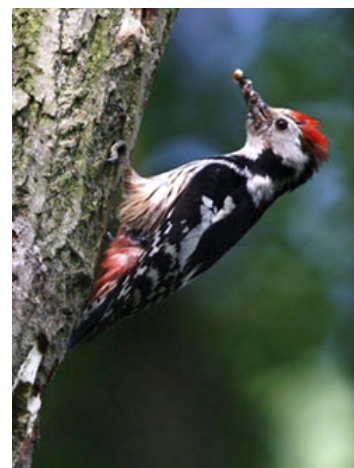
Pic mar