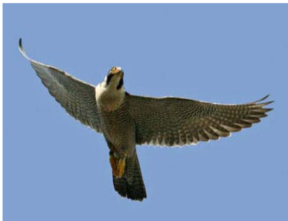
Faucon pèlerin