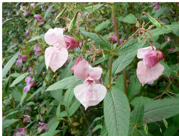
Photo 2 : Insertion des fleurs, feuilles verticillées par trois, et capsules allongées