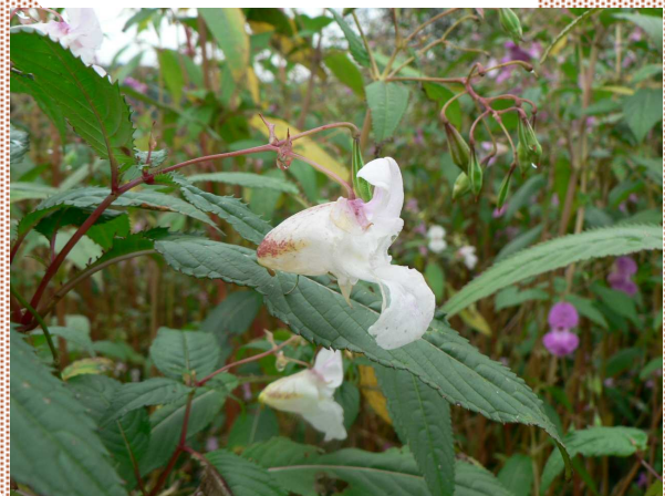
Photos 3 et 4 : Panel de couleurs des fleurs de la balsamine de l'Himalaya et capsule en avant-plan