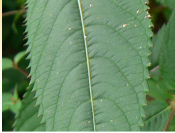
Photos 5 et 6 : Eperon atrophié et feuille de Balsamine de l'Himalaya