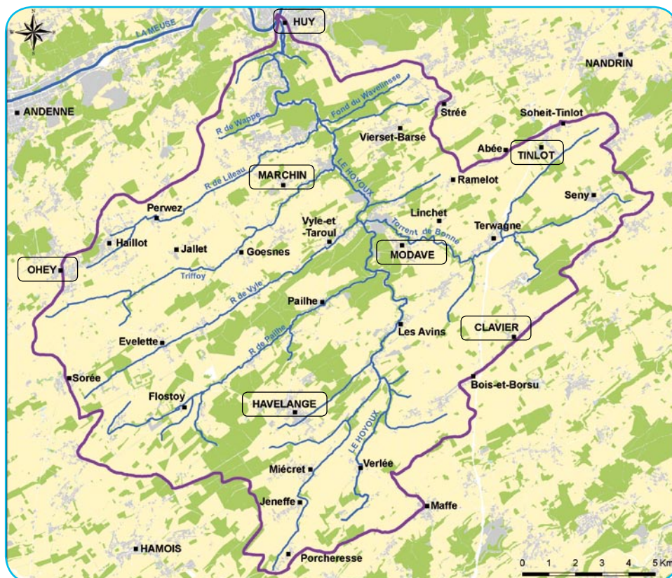
Cartographie : SPW - DGARNE - Coordination géomatique