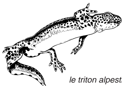
le triton alpestre