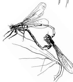
un accouplement de demoiselles